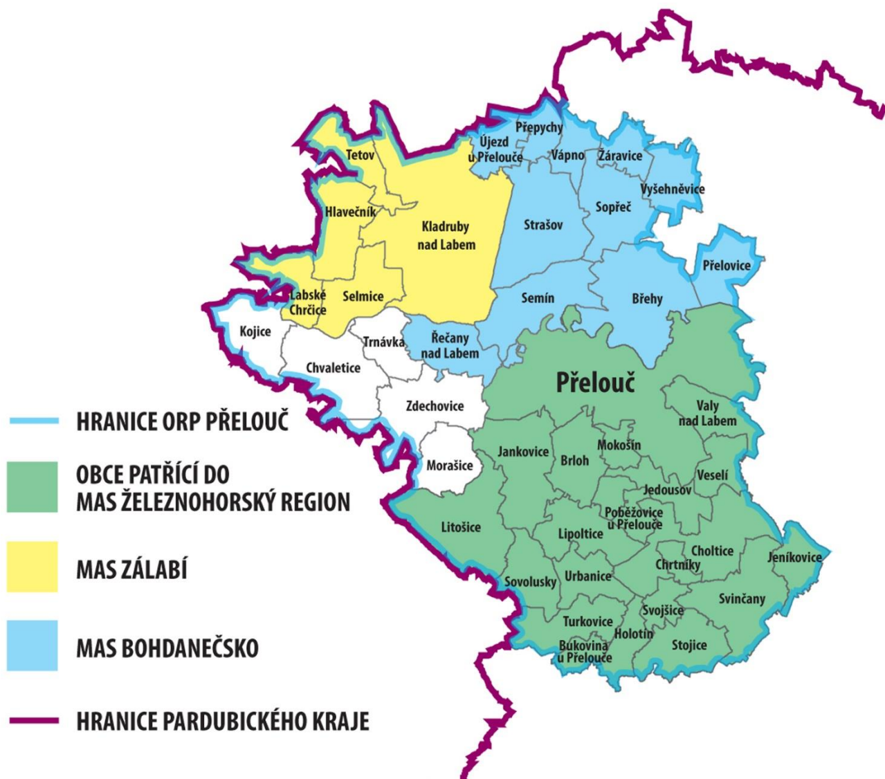
Obrázek 1 Struktura ORP Přebouč dle hranic MAS na území daného ORP

z nichž MAS Železnohorský region (MAS ŽR) zahrnuje nejvíce obcí z daného ORP a má v území nejdelší tradici (působí již od roku 2005). MAS ŽR je v tomto ORP také největší MAS, co se týče počtu obyvatel.