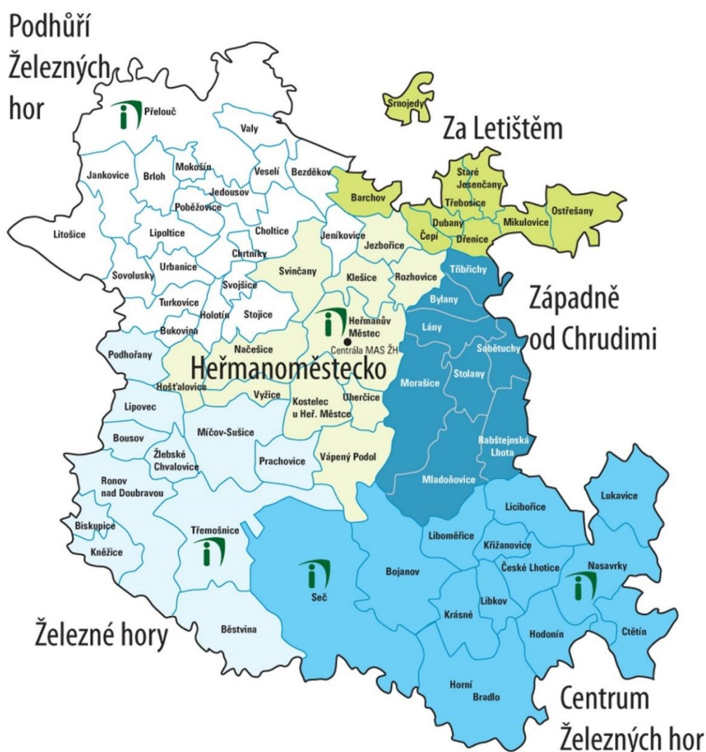
Obrázek 3 Území MAS Železnohorský region s dobrovolnými svazky obcí (DSO)

MAS Železnohorský region (MAS ŽR) byla založena v roce 2005 s právním statutem občanského sdružení. Od roku 2015 je MAS ŽR zapsaným spolkem. Sídlo MAS ŽR je v Multifunkční budově (kde sídlí také Informační centrum) v Heřmanově Městci. V současné době se území MAS ŽR rozkládá na území 6 svazků obcí (Heřmanoměstecko, Centrum Železných hor, Podhůří Železných hor, Za Letištěm, Západně od Chrudimi a Železné hory) a 1 obce Licibořice (viz níže mapa MAS Železnohorský region s dobrovolnými svazky obcí). Území má celkem 72 obcí a celkově kolem 45 tisíc obyvatel – z nichž na území ORP Přelouč se jedná o počet přibližně 12 tisíc obyvatel, což představuje cca 45 % všech obyvatel ORP Přelouč (celé ORP Přelouč má celkem 26 522 obyvatel k 31. 12. 2022).