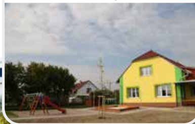
Rekonstrukce Mateřské školy ve Valech – 2. etapa

Interaktivní mapa s realizovanými projekty