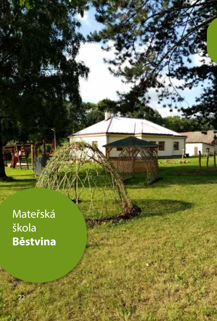
Mateřská škola Běstvína