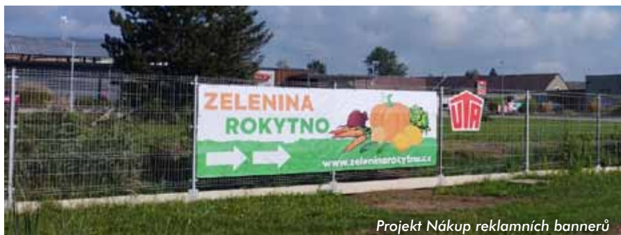
Projekt Nákup reklamních bannerů

www.regionalni-znacky.cz/kraj-pernstejnu/