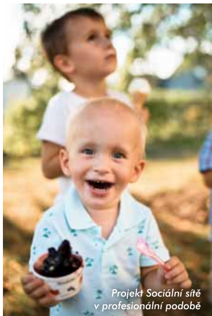
Projekt Sociální síť v profesionální podobě

Kreativní vouchery pro Kraj Pernštejnů již podruhé podpořily projekty lokálních producentů v hodnotě přes 160 000 Kč.