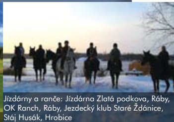
Jízdárny a ranče: Jízdárna Zlatá podkova, Ráby, OK Ranch, Ráby, Jezdecký klub Staré Ždánice, Stáj Husák, Hrobice