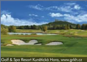
Golf & Spa Resort Kunětická Hora, www.grkh.cz