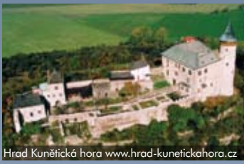
Hrad Kunětická hora www.hrad-kunetickahora.cz