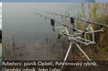
Rybaření: písňík Opatil, Pohránovský rybník, Újezdský rybník, řeka Labe

Více informací o jednotlivých aktivitách včetně podrobných propagačních materiálů a map obdržíte v Infocentru Děda Vševěda v Muzeu perníku v Ráběch.