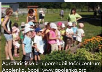
Agroturistické a hiporehabilitační centrum Apolenka, Spojič www.apolenka.org