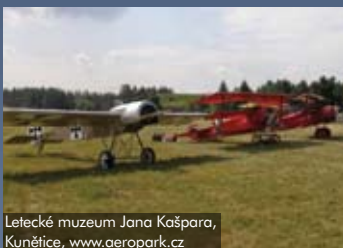
Letecké muzeum Jana Kašpara, Kunětická Hora, www.aeropark.cz