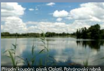
Přírodní koupání: písňík Opatil, Pohránovský rybník