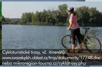
Cykloturistické trasy, vč. itinerářů www.svazekpkh.oblast.cz/tmp/dokumenty/17748.doc nebo mikroregion-loučna.cz/cyklotrasy.php