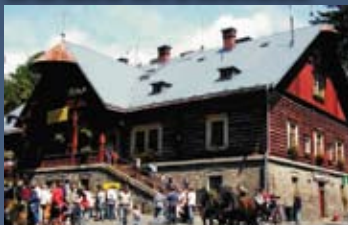
Muzeum perníku, Ráby, Sousedské slavnosti, každoročně 8.května www.pernikova-chaloupka.cz