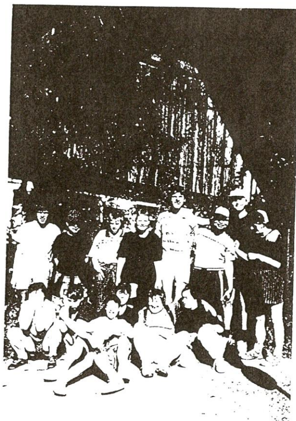
Rehabilitační pobyt ve Stárkově

V červenci se konala v Praze Speciální olympiáda v lehké atletice, cyklistice stolním tenise, kde nás reprezentovalo 6 členů s dobrými výsledky. K některým z akcí se ještě vrátíme na jiném místě.