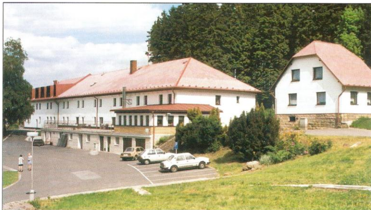
Areál Ústavu sociální péče v Hajnici.