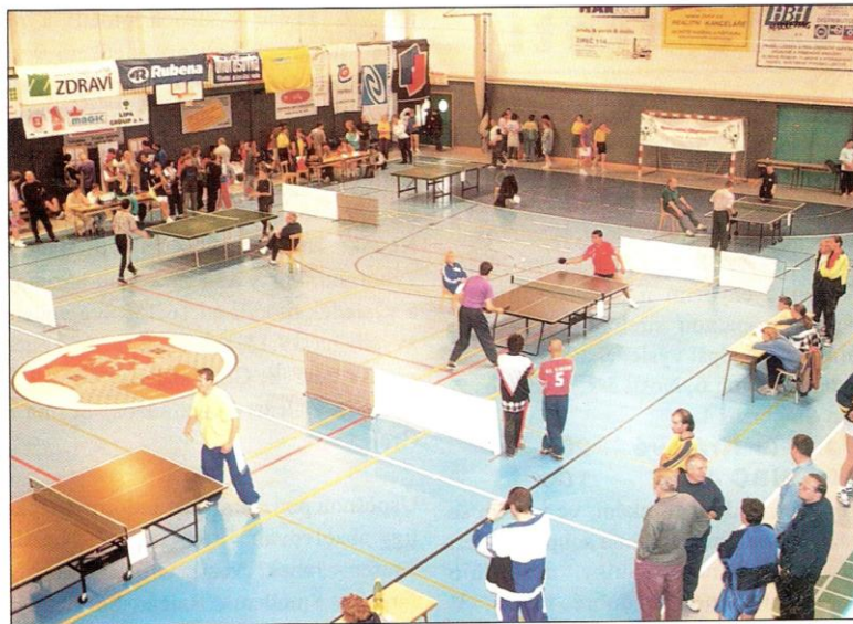
Pohled do haly ZŠ Strž v průběhu turnaje ve stolním tenisu.